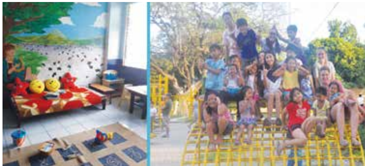
Det nya lekrummet för barngruppen. De får stöd och undervisning medan deras mammor genomgår lärlungaskola på rehabiliteringscentret i Olongapo.