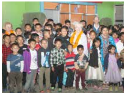
Arkenteamet med alla barnen som vi stödjer i Nepal.