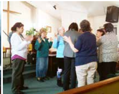
Bön under en helandedag i Keshena Wisconsin.