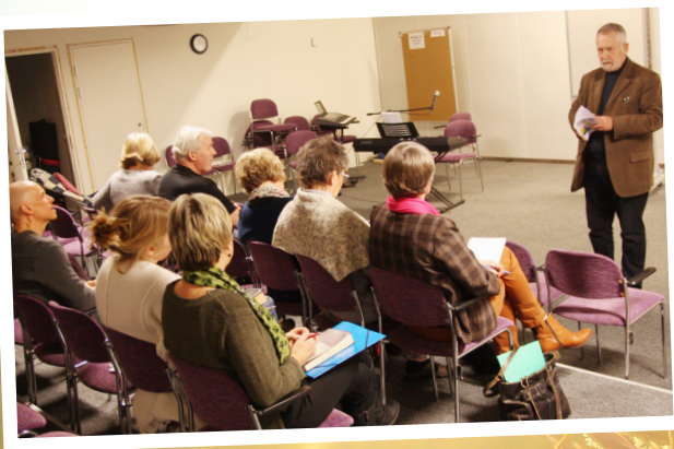
Elever på bibelundervisningen